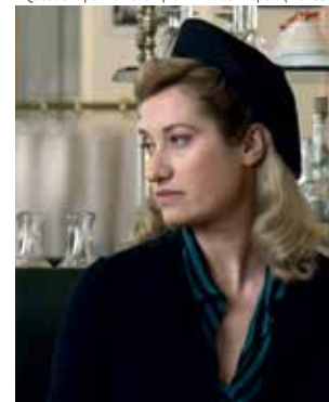
« Violette » de Martin Provost, avec Emmanuelle Devos