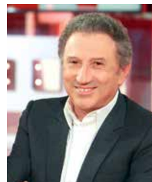
« Vivement dimanche » - Michel Drucker (France 2)