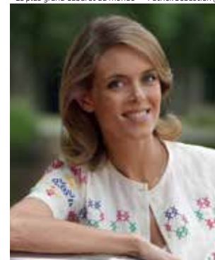
« Les Carnets de Julie » - Julie Andrieu (France 3)