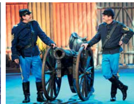
« Signé Taloché » (RTBF)