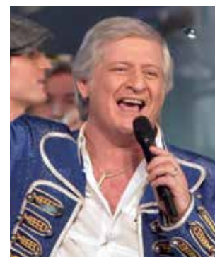
« Le plus grand Cabaret du monde » - Patrick Sébastien (France 2)