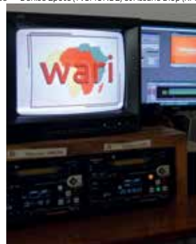
« Wari »