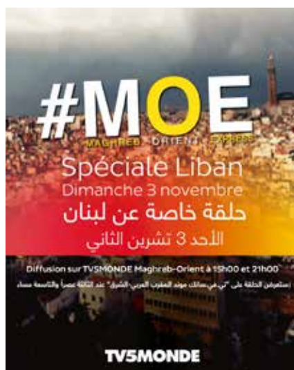
« Maghreb Orient Express »

Cette émission, présentée par Mohamed Kaci, reçoit les personnalités de la société civile et du monde culturel, au cœur de l'actualité en Méditerranée. Elle est régulièrement délocalisée. Une rediffusion sous-titrée en arabe a lieu tous les lundis soir.