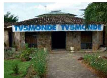
Maison TV5MONDE au Burundi

TV5MONDE Afrique est présente sur twitter.com/tv5mondeafrique avec près de 7000 followers.