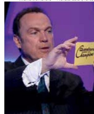
« Questions pour un champion » - Julien Lepers (France 3)