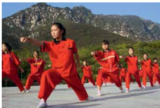
« 360° GEO - Chine, les filles aussi font du kung-fu » - d'Inès Possemeyer

TV5MONDE devrait prochainement créer une chaîne thématique « Art de vivre » à destination de ces publics en priorité pour l'Asie, les pays du Golfe, les Amériques et l'Europe.