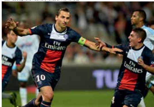
Le championnat de la ligue 1