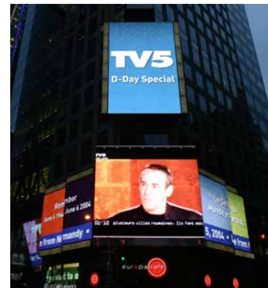
Diffusion de TV5 sur Times Square (New York), programmation spéciale D-Day, juin 2004