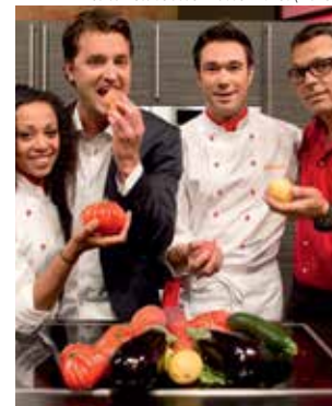
« Al dente » (RTS)