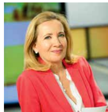
« 7 jours sur la planète » - Valérie Tibet

*sur tv5monde.com et m.tv5monde.com , l'information est accessible 24h/24 via TV5MONDE+Info qui permet de regarder en continu JT et flashes ( tv5monde.com/info )